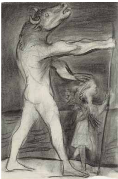
"El Minotauro ciego guiado por una niña" Dibujo realizado en otoño de 1934. Carboncillo 51x35 cm. Collection Hamburger Kunsthalle.

nera nos lo pondría en relación con el Minotauro ciego bajando de la barca de los marineros.