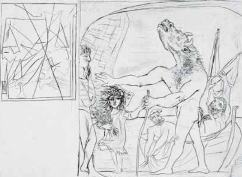
"Suite Vollard (L089). Minotaure aveugle guidé par une fillette". "Suite Vollard (L096). Toro alado contemplado por cuatro niños".