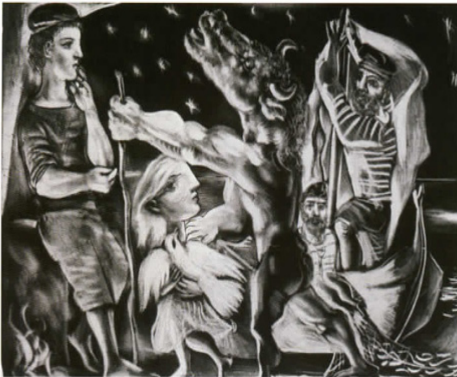
"Suite Vollard (L092). La noche estrellada".

pia muerte. Los escritores y artistas plásticos del surrealismo modifican esa concepción negativa y la desarrollan en múltiples ejemplos de noches estrelladas. La noche revelaría también la situación de inquietud, desasosiego y desorientación del mismo Picasso. Pero en palabras del escultor Julio González: " En la inquietud de la noche, las estrellas parecen revelarnos puntos de esperanza en el cielo... " 13 . El grabado de la noche estrellada del Minotauro ciego recibirá un retoque final el 1 de enero de 1935 y será el último trabajo en el que aparezca. A partir de este momento desaparecerá de su producción. En la navidad de 1934-35 Marie Thérèse Walter le confiesa a Picasso que está embarazada.